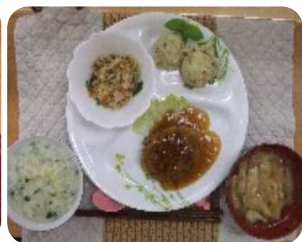
七草粥で一年の健康や正月に食べ過ぎの胃腸を休めましょう。