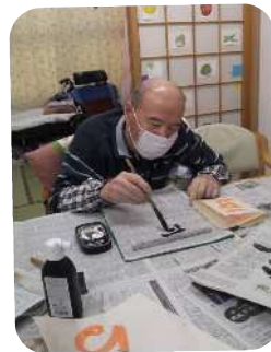
大きな字を書く練習をかね、みなさん書初めに挑戦です