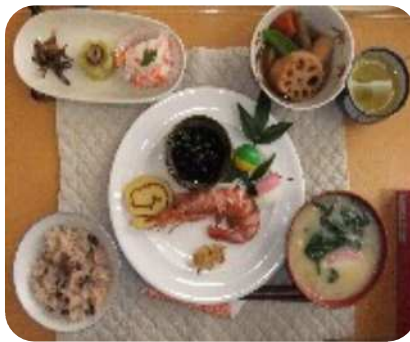
おせち料理 厨房の方が精魂込めて作って下さったおせちをお腹一杯堪能しました。

コロナ禍の中で、自粛生活を余儀なくされている方も多い中、福祉業界は、感染予防をしっかりとすうえで、通常通りの生活を粛々と送っています。とはいってもでかけられないし、密を避けるのは至難の業です。屋内で楽しく過ごすにはやはり「食べること」「笑うこと」「からだをうごかすこと」です。今年もコロナの早い終息を願いつつ、笑顔がいっぱいあふれますように！