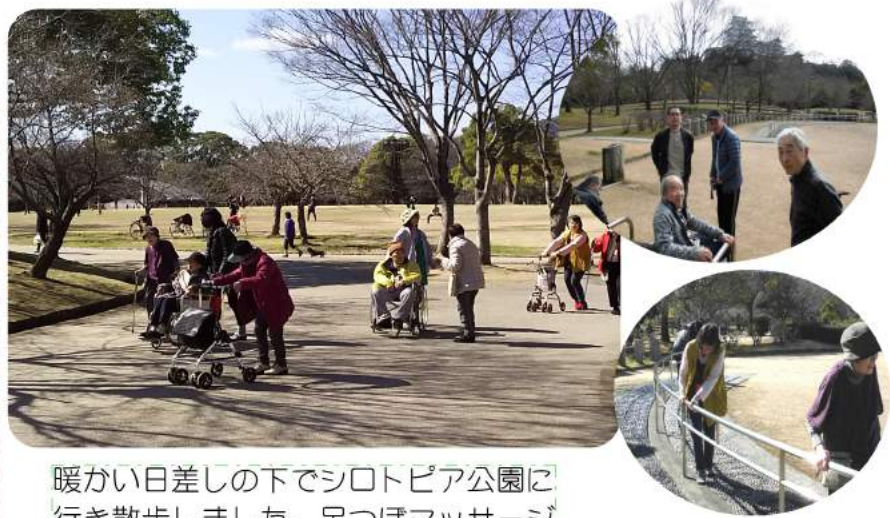
暖かい日差しの下でシロトピア公園に行き散歩しました。足つぼマッサージも気持ち良かったですよ。

統合して2カ月が過ぎました。利用者さんも職員もだいぶ慣れてきて少し落ち着きを取り戻したのではないのでしょうか。「生活向上為リハビリ」と言われ、リハビリということに意識しすぎて、しんどい思いをされたかもしれません。楽しいことをいっぱいする中で、自然にリハビリが出来るのが一番と考えます。1日終わって、「しんどかったな〜」ではなく「楽しかったな〜」と言われるような取り組みをしていきたいと思ひます。やりたいことがあればどんどん提案して下さい。