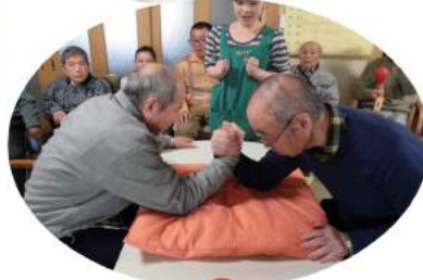
ミニ運動会を開催しました。射的や腕相撲、パン食い競争など試合となると力が入ります。