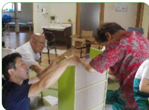
これから利用者さんと共に“輪”を作り上げていきます。施設に必要な備品もみんなで組み立て。