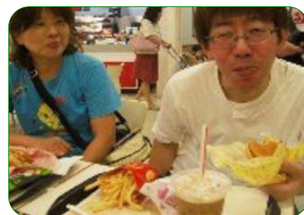
行動にも比較的、自由がきます。この日のお昼は若者同士？でマクドナルドへ。