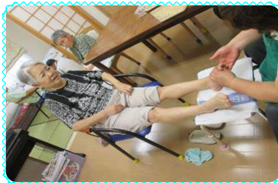
オイルマッサージ