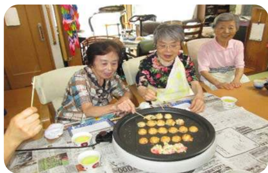
タコヤキパーティー おいしくできました。