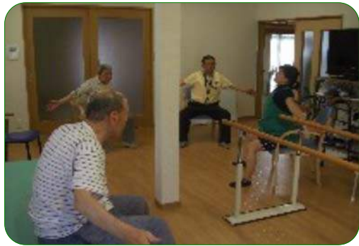
BIG体操 …まずは基本の形をしっかりと。だんだんキツくなりますよ～（笑）