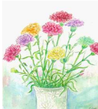
絵手紙教室 芹澤登代子氏 作品