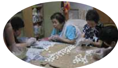
ゴキブリ団子作り