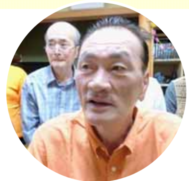
第54代横綱 輪島大士氏