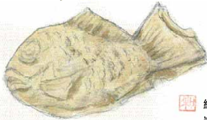
絵手紙教室 岩村和雄氏作品