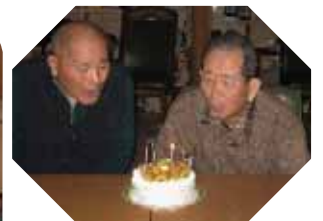
今月のお誕生会は、金曜日と土曜日の2回に分けて行いました。金曜日は、カラオケボックスを借り、お弁当と職員の手作りチーズケーキを持込で、総勢21名で大盛り上がりしました。『楽しかった、また行きたい!』『私も行きたかった』という利用者様のお声を聞きしていますので、またいつか計画したいと思います。

『楽しかった、また行きたい!』『私も行きたかった』という利用者様のお声を聞きしていますので、またいつか計画したいと思います。