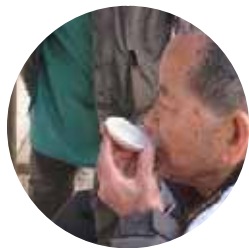
総社でお神酒をいただきました。

1月4日から一週間は初詣週間として、総社、曾根天満宮、鹿島神社、北条天満宮とたくさんのお参りしました。多い方は、3回くらい行かれているのではないかと思います。かなりご利益がありそうですね。