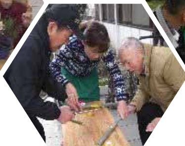
今年は竹も上手に切れました。