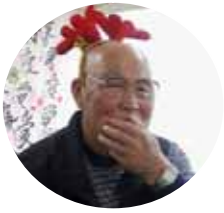
素敵なサンタさん でしょう