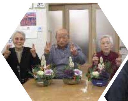
飾りを一つ入れるだけで豪華になりました。